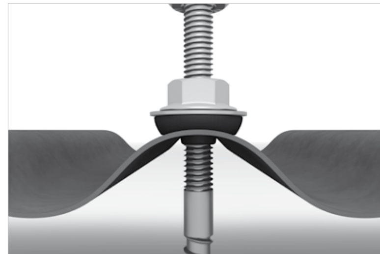
Détails de l'image: vis à double filetage avec FZD Dichtung